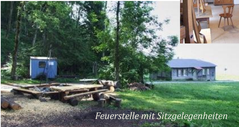
Feuerstelle mit Sitzgelegenheiten

wunderbare Aussicht auf den Schwyzer Talkessel, die umliegenden Berge und die zwei Seen !